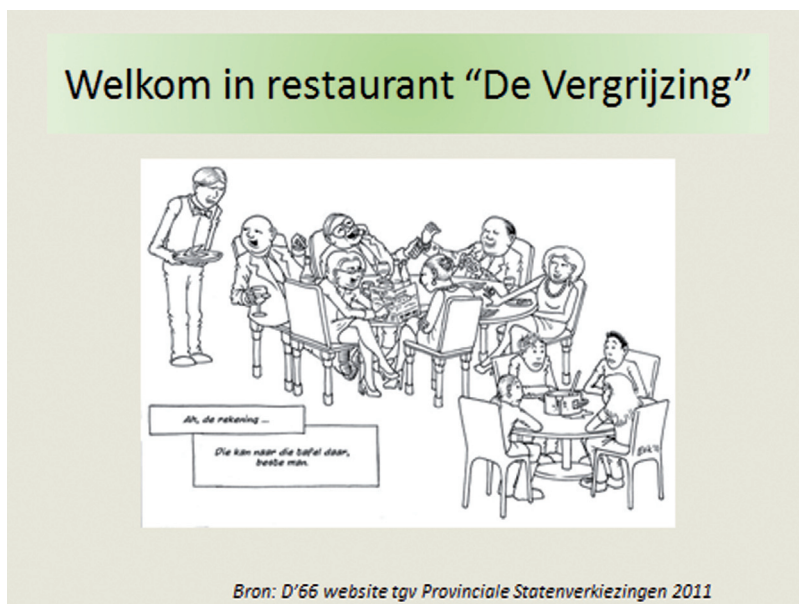
Figuur 1: D66-cartoon betreffende de intergenerationale verhoudingen (2011).

Ook onder ouderen lopen de emoties hoog op maar toch zijn de publieke tegengeluiden schaarser en zwakker. Ze blijven voornamelijk beperkt tot columns, ingezonden brieven, reacties op blogs of